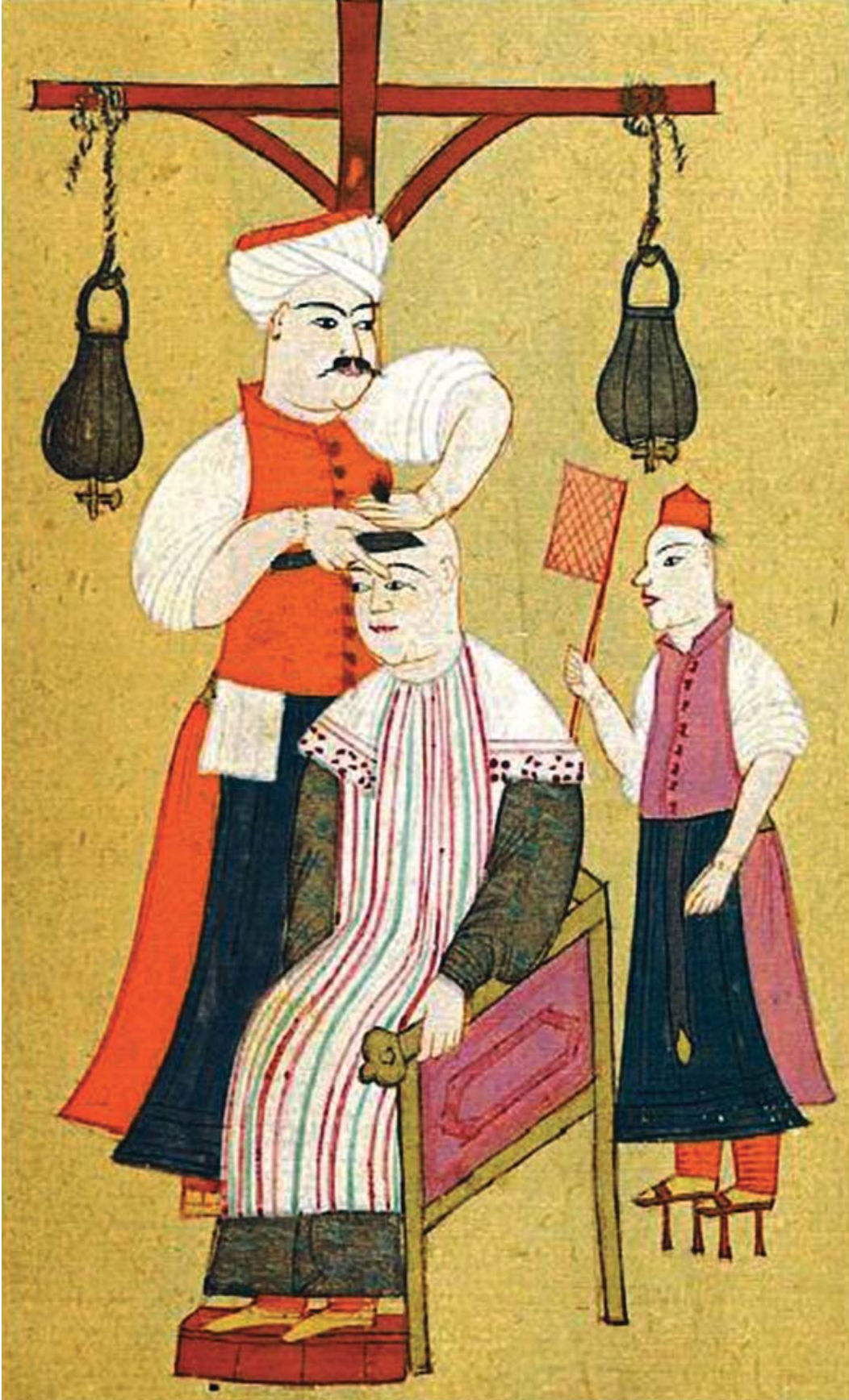
Resim 2. 17. Yüzyılda bir ayak berberi müşterisini tıraş ederken